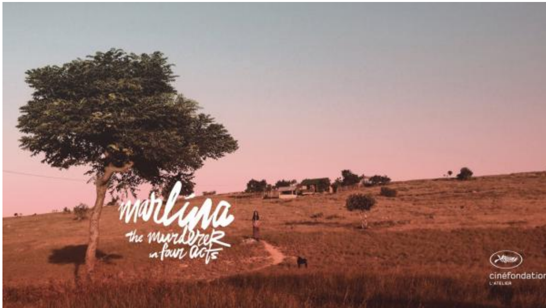
Poster of Marlina the Murderer in Four Acts directed by Mouly Surya DR

Released on 24-05-2017 Modified 24-05-2017 to 11:52